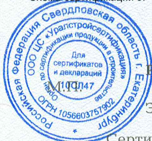
Схема сертификации 3.